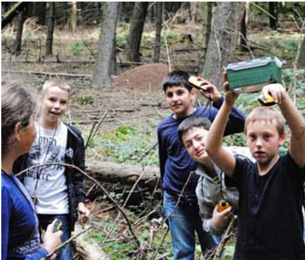
☒ Hier sind gut ausgebildete Betreuer wichtig: Schatzsucher im Wald vor einem Ameisenhaufen.