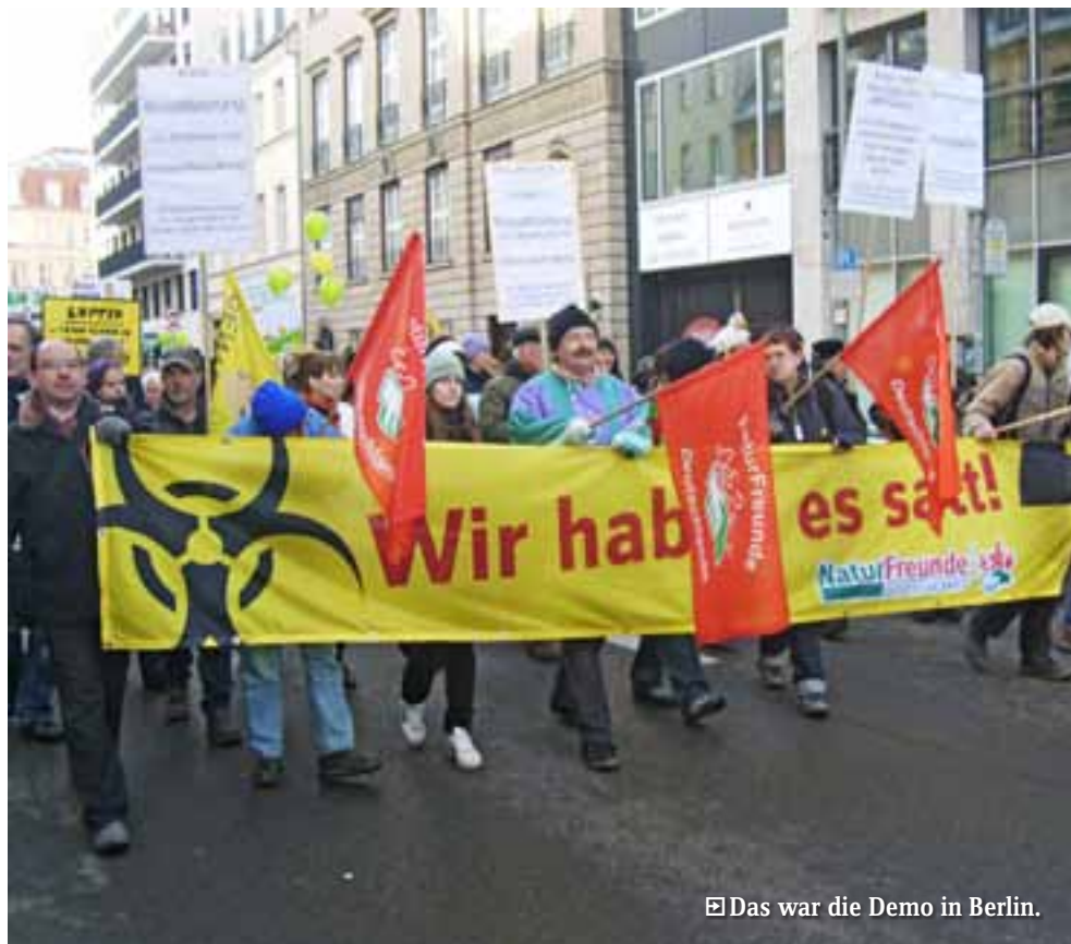
☒ Das war die Demo in Berlin.

Hoffentlich hat diesen Appell auch die Bundesregierung gehört. ■ ECKART KUHLEWINE