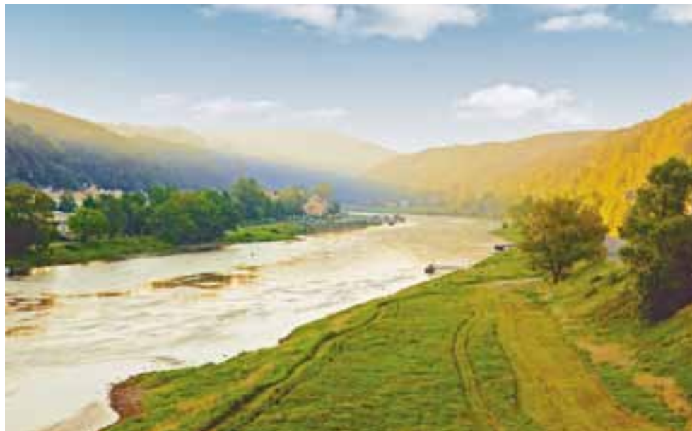
☒ Traumhaft ist das Elbtal in der Sächsischen Schweiz - und zieht hier auch Paddler an (oben).

den internationalen Häfen an 345 Tagen im Jahr gesichert werden. Und gesichert heißt: Der Fluss muss eine durchgehende Tiefe von 1,60 Metern aufweisen.