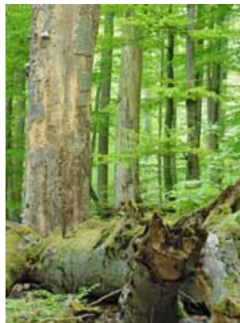
Auf dem Foto links die Feuersalamanderschlucht im Steigerwald, in der man tatsächlich die seltenen Amphibien beobachten kann.