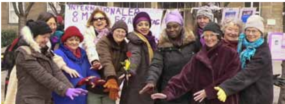
☒ Mitglieder des Frauenverbandes Courage werben für die Weltfrauenkonferenz in Venezuela.

nachteiligt. Deshalb wird vom 4.-8. März 2011 die erste Weltfrauenkonferenz der Basisfrauen unter dem Motto: „Die Zeit ist reif für einen neuen Aufbruch der Frauenbewegung“ in Caracas/Venezuela stattfinden. Die Weltfrauenkonferenz will den weltweiten Erfahrungsaustausch, die internationale Vernetzung und Zusammenarbeit der Frau-