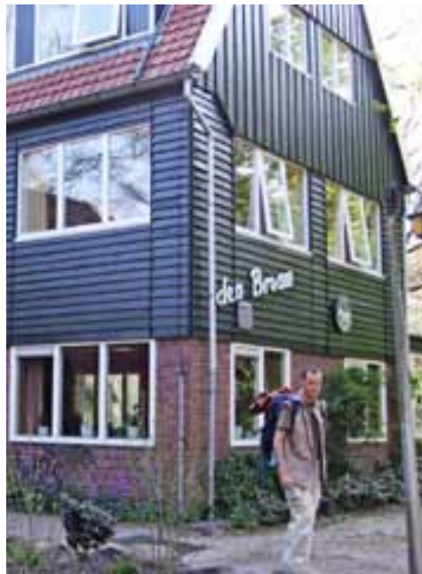
☒ Sieht zwar nicht so aus, heißt aber Brombeere: Naturfreundehaus am Weitwanderweg.

Solange werde ich nicht mehr warten. Der Nebel ist nicht dichter geworden und die Route hervorragend markiert. Bald müsste eine Wachol-