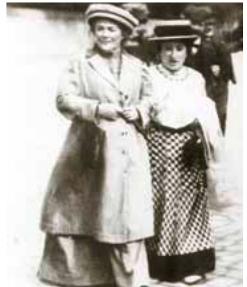
☒ Clara Zetkin (links) mit Rosa Luxemburg (1910).

Kampf für das Recht der Frauen auf Arbeit und ökonomische Selbstständigkeit sowie für den Schutz von Mutter und Kind.