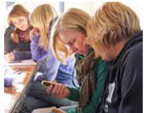
☒ Die GPS-Technik fasziniert junge Menschen.

Zudem werden Schulklassen, die im Naturfreundehaus Ebberg (G 8) zu Gast sind, von Mitgliedern der Naturfreundejugend in die digitale Schatzsuche eingeführt. Die örtliche Volksbank war begeistert und sponsorte einige GPS-Geräte. Die nordrhein-westfälischen NaturFreunde legen auch Caches an Naturfreundehäusern an: „Damit wollen wir möglichst viele Schatzsucher auf unseren Verband aufmerksam machen, denn natürlich interessiert man sich für den Ort, zu dem einen die GPS-Koordinaten geführt haben“,