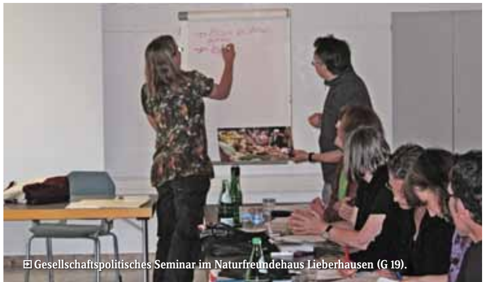
☒ Gesellschaftspolitisches Seminar im Naturfreundehaus Lieberhausen (G 19).

Die Auswertungen der Seminare haben übrigens ergeben, dass ein guter Referent und ein stimmiges Hauskonzept – passend natürlich zu den Inhalten der angebotenen Seminare – weit aus höher bewertet werden, als etwa ein reibungsloser Seminarbetrieb oder gar eine luxuriöse Unterkunft. Es kommt tatsächlich auf die Inhalte und den Nutzwert für jeden Teilnehmer an. Doch jede Seminarreihe muss sich erst her-