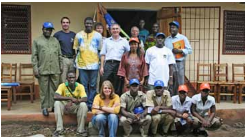
☒ Togoische und deutsche Klimaprojektpartner vor einer Schule im togoischen Lycee Zomayi.

Ohne die „Umweltbildung Bremen“, die unser Projekt finanziell unterstützt, wären die