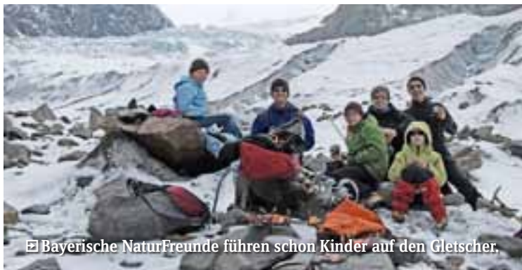
Bayerische NaturFreunde führen schon Kinder auf den Gletscher.

22.-24.7.2011 · Die Eisfamilie Ort: Kaunertal (A) · Ausschreibung: www.kurzlink.de/Eisfamilie · Kontakt: NaturFreunde Bayern · (0911) 23 70 50 www.bayern.naturfreunde.de