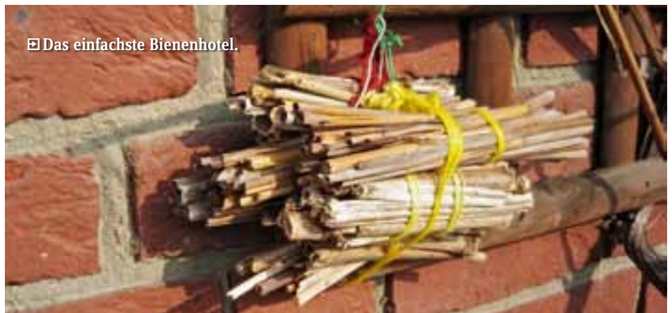
Das einfachste Bienenhotel.

geschnitten. Die Stängel jetzt bündeln und an einem Band in Süd-Ost-Ausrichtung und wetter- und windgeschützt aufhängen. Das Bündel sollte nicht hin- und herwackeln. Nicht angenommene Hotelzimmer bei Gelegenheit renovieren.